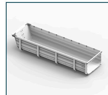
NOVA CAIXA DE CARGA