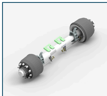
EIXOS 13 TONELADAS